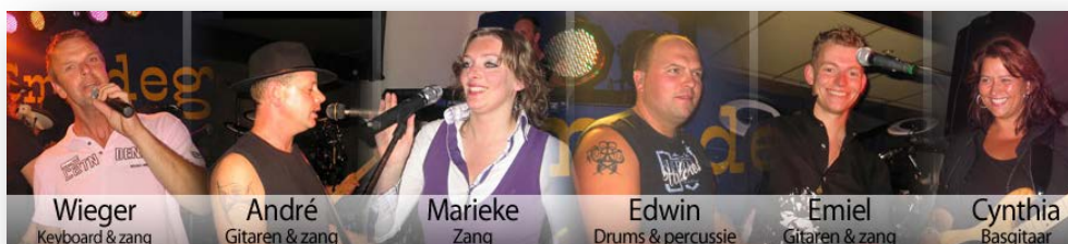
Wieger Keyboard & zang

Verkleeden mag, niets moet, maar is wel leuk!