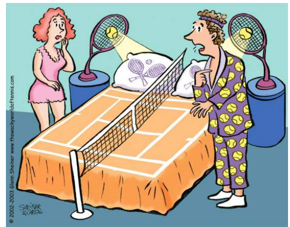
Hoezo ben ik geobsedeerd door Tennis?

We hopen je tussen maandag 1 en zondag 7 september te mogen verwelkomen op de tenniscourten van TC Annen als deelnemer of supporter!