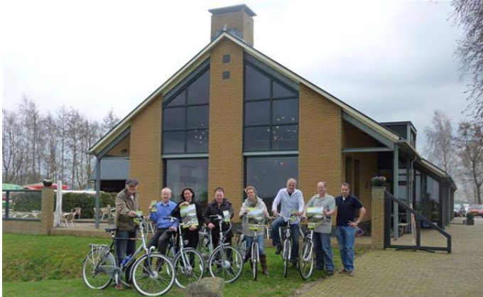
De uitbaters van de deelnemende restaurants staan startklaar voor Paviljoen Breeland.