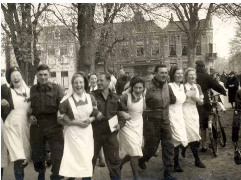
Bijschrift foto: Verpleegsters van het Wilhelmina Ziekenhuis dansen en zingen met Canadese soldaten tijdens de bevrijding.

'Drenthe in Oorlogstijd' is te zien van 1 t/m 4 mei, de themafilm 'Wonen en werken in Drenthe' wordt vanaf 8 mei in het Drents Archief vertoond. Beide films zijn tijdens openingstijden doorlopend te bekijken in de Digilounge van het Drents Archief en duren ongeveer 30 tot 45 minuten. De toegang is gratis. De openingstijden zijn dinsdag t/m donderdag 10.00-17.00 uur en vrijdag 10.00-13.00 uur. Op feestdagen én op vrijdag 11 mei is het Drents Archief gesloten.