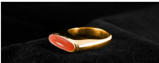
Foto: Gouden herinneringsring met as & haar van haar overleden vader, vervaardigd van oude dierbare sieraden van haar vader.

Samen met u ontwikkelen wij een sieraad met uw verhaal! Het eindresultaat is telkens weer een unieke ervaring. Het blijvende gevoel wat mensen bij zo'n sieraad hebben is fantastisch!