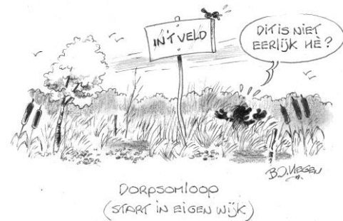
Dorpsomloop (start in eigen wijk)

Even lunchen, en op naar de dorpsomloop. Prachtige spellen waren in alle buurten opgebouwd. Ploeg Boersma liet iedereen in de haven vloten bouwen en als echte brandweermannen 'waterspuiten'. Ploeg Posthouwer met 'de Verboden vrucht' had een spannend spel met echte appels en bij ploeg Kregel moesten de deelnemers hun eigen sjoelstenen bijeen zagen. Op naar ploeg Hamstra waar met tennisballen in buizen op een helm een parcours moest worden afgelegd. Bij ploeg Harms moesten alle deelnemers al buikglijdend (hadden we dan niet dinsdag al gedaan?) een bal door een gat gooien. Vervolgens kwamen we aan bij ploeg Dijkema die zoals altijd een spel had in het zwembad waarbij één