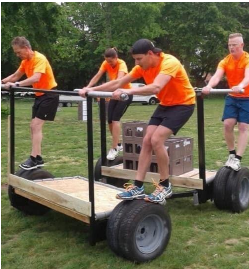
Het dorpsomloopspel van Ploeg Oranje in 2019

Er zijn veel leuke spellen bedacht maar een van de toppers is toch wel het spel uit 2019. Voor dit spel werden twee aanhangerassen gekocht, omgebouwd en aan elkaar gelast tot een loopkar die door op de wielen te lopen naar voren kon worden gebracht. Met dit spel moesten kratten met daarop romeinse cijfers worden vervoerd die vervolgens op volgorde werden geplaatst. Uiteindelijk bleek het nog aardig lastig!