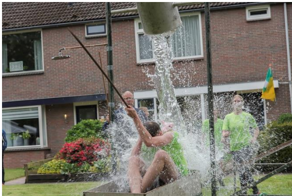
Het Dorpsomloopspel ploeg Groen 2018

Ons bouwteam bestaat uit een zestal creatievelingen. Gezelligheid staat voorop en voorafgaand aan de creatieve brainstormsessie wordt de creatieve geest gevoed door een mix van water, hop, mout, etc. Na zeker een tiental vergaderingen komen we met een definitief spel, waarvan het thema vaak in de eerste vergadering al bekend is (!). Uitgangspunt van ons spel is altijd: uitdagend, leuk voor het publiek en spelers en een eenvoudige en begrijpelijke puntentelling. Nu het spel op papier staat en is ingediend voor goedkeuring, begint het verzamelen van de materialen en het bouwen. Uiteraard wordt het spel uitvoerig getest door het bouwteam.