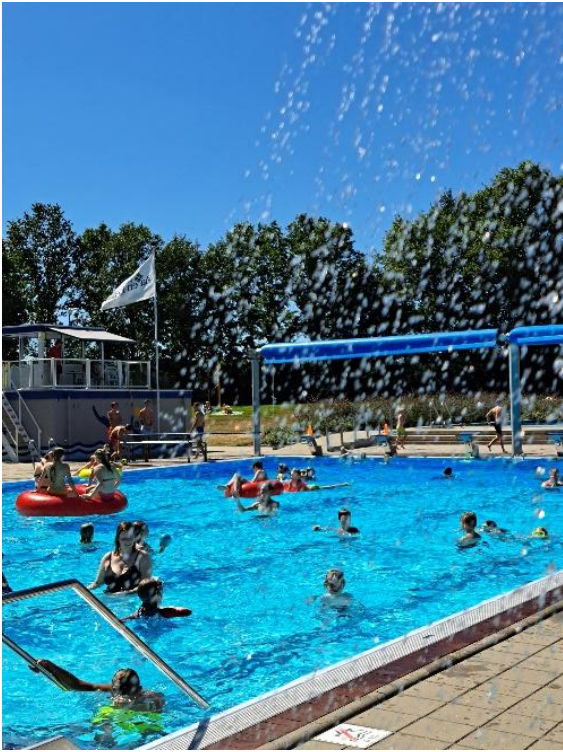
Winnende foto van Henk Tjeerdsma (Fotograaf van het jaar 2022)