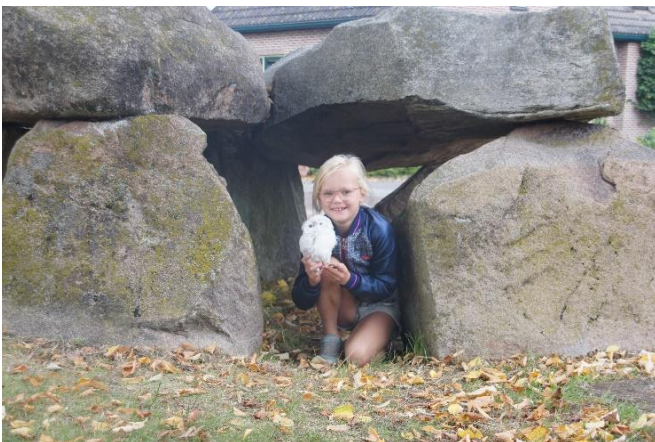
Winnende foto van Janne Bouma (Kinderfotograaf van het jaar 2022)