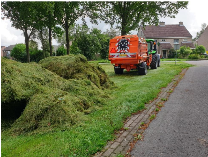
De nieuwe gras opraapwagen, de 'Panda' met opgeraapt verzameld gras

We maaien het gras, afhankelijk van de locatie en de situatie, één of twee keer per seizoen. Op andere locaties wordt gefaseerd of eens in de maand gemaaid. Bij gefaseerd maaien blijft steeds een ander deel van het gras staan. Het maaisel wordt met een hark en opraapwagen van het gras gehaald. Door het maaisel af te voeren verschromelen de bermen en gazons waardoor bloemen nog meer kans krijgen.