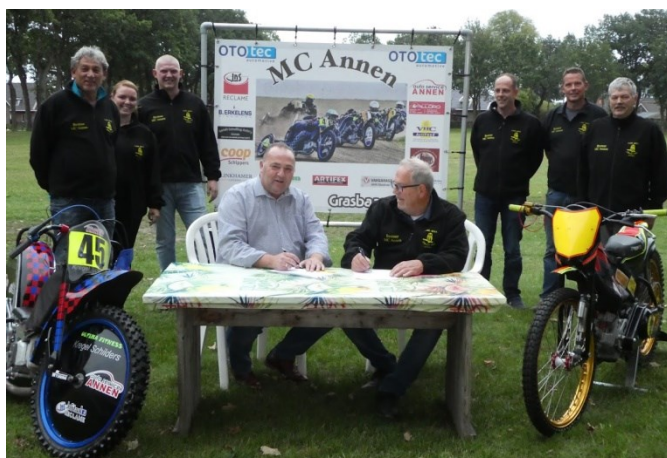
De ondertekening van het eerste contract in het voorjaar van 2019

In 2019 heeft MC Annen een nieuwe hoofdsponsor voor de komende 3 jaren weten te strikken, maar door Corona bleef dit beperkt tot de wedstrijd in 2019. Gelukkig heeft het bedrijf Ototec zich bereid verklaard om het contract te verlengen t/m 2024, zodat men ook de komende 3 edities het evenement kan organiseren als Ototec Grasbaanraces.